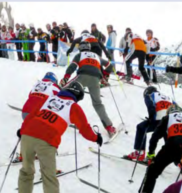
Start am Rüfikopf